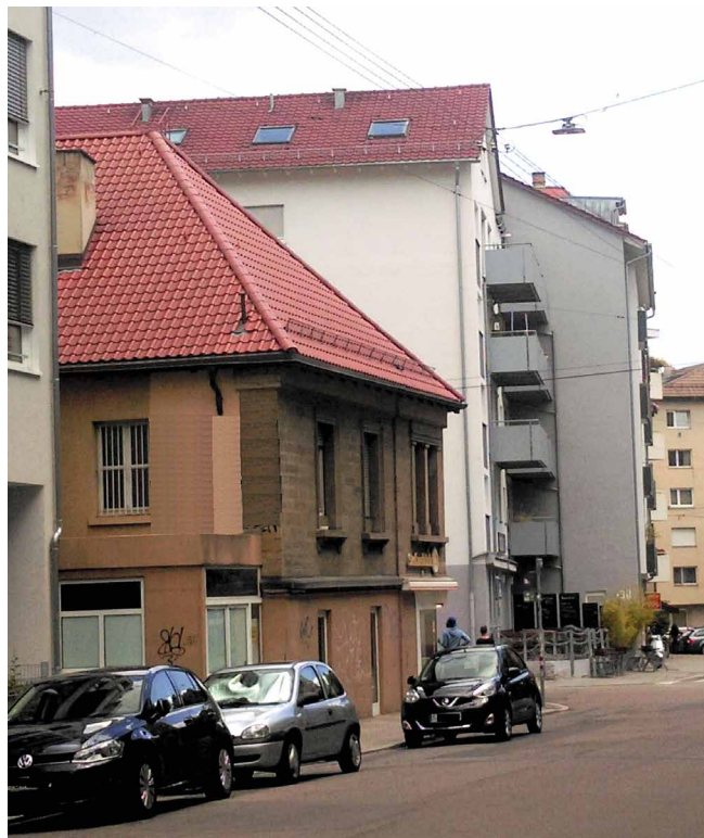
Abb. 1: Die EU-Gebäuderichtlinie fordert, dass der Fokus der energetischen Sanierung auf die schlechtesten energetischen Gebäude fällt. Dazu gehören Einfamilienhäuser, erbaut vor der ersten Wärmeschutzverordnung (WSchVO 1977).

regierung in ihre Koalitionsvereinbarung mit auf. Seither wartete die gesamte Fachwelt mit Spannung, wie die Umsetzung in die Praxis vonstattengehen wird.