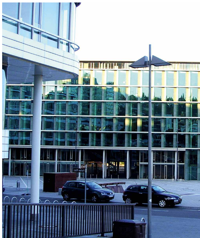
Abb. 3: Wenn Bürogebäude »in die Jahre kommen« und technisch nicht mehr den Anforderungen der Nutzer entsprechen, bietet sich als Lösung an, sie als Wohngebäude umzunutzen.

Berufliche Verbände: Sehr kritisch sieht die Bundesarchitektenkammer (BAK) die vorgestellten Eckpunkte zum GMG: Die Leitplanken würden gelockert, gleichzeitig werde für 2030 eine Evaluation mit möglicher Nachsteuerung angekündigt. Dieses Vorgehen schaffe Unsicherheit und verteuere Projekte. Es ersetze kei-