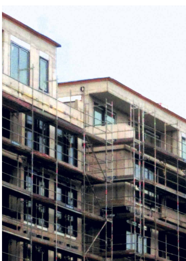
Abb. 2: Neubauten sollen – laut EU-Gebäuderichtlinie – ab 2030 alle als Nullenergiehäuser geplant und errichtet werden.

Wärmeplanung: Zahlreiche, vor allem größere Kommunen, hätten bereits mit der Wärmeplanung begonnen oder diese sogar schon abgeschlossen. Für viele kleinere Kommunen seien die Anforderungen jedoch herausfordernd und mit hohem Aufwand